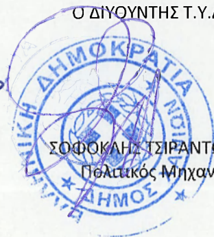
ΣΟΦΟΚΛΗΣ ΤΣΙΡΑΝΤΩΝΑΚΗΣ Πολιτικός Μηχανικός